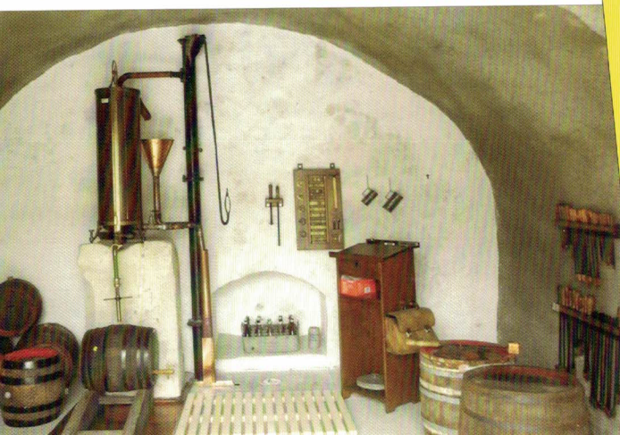
Wiederherstellung des Eichbrunnens – älteste Fasseichanstalt in Bayern