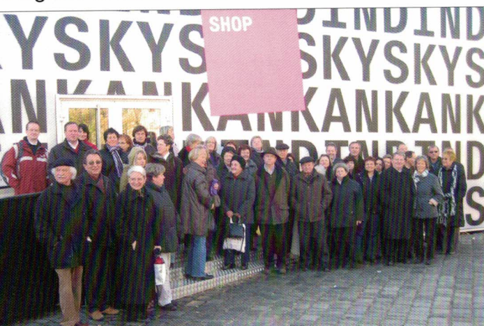
Fahrt zur Kandinsky-Ausstellung