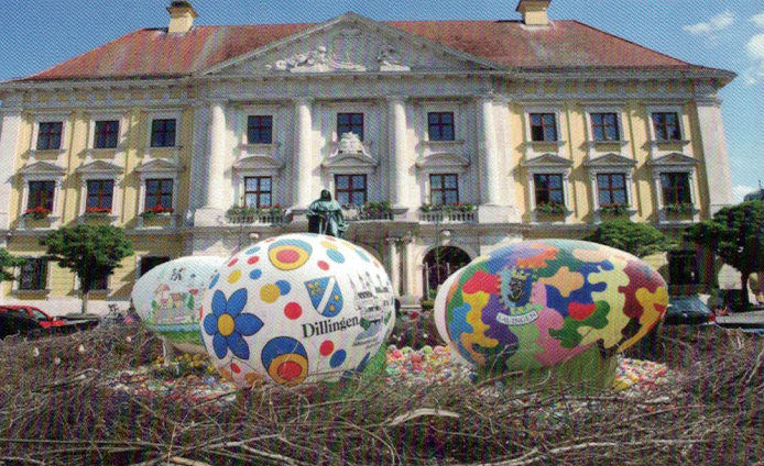
Das größte Osternest der Welt